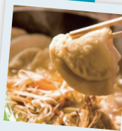
なんでも美味しい〜